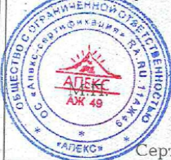
Схема сертификации: 1с.